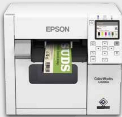
Gamme ColorWorks C4000e